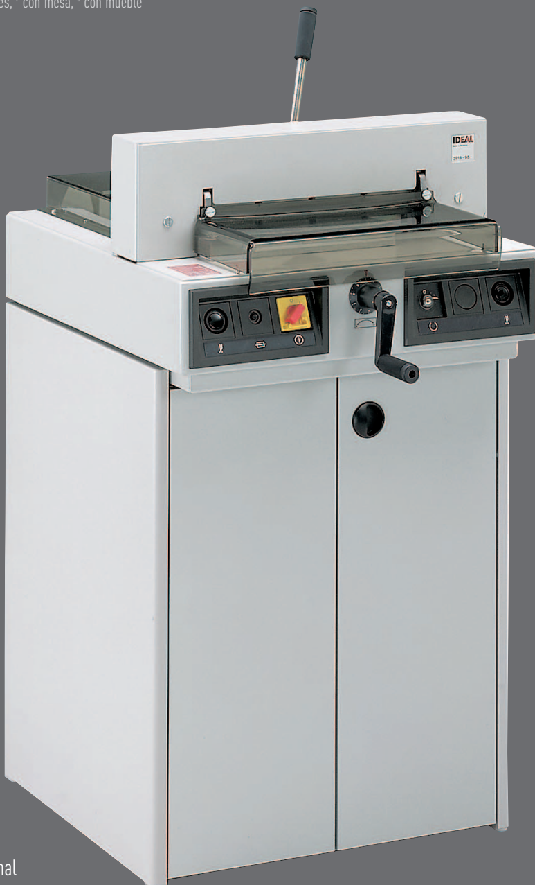
IDEAL 3915-95 con mueble adicional

1 otros voltajes disponibles, 2 con mesa, 3 con mueble